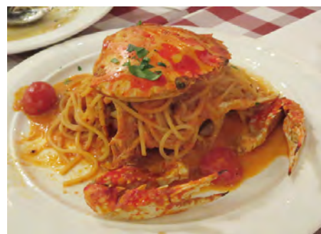
L-14 花蟹面 渡り蟹のパスタ

※ Additional Dessert Option (Daily Dessert + Non Alchole Drink).