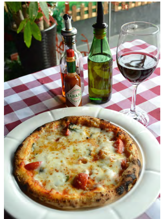
L-2 玛格丽特匹萨 + 红葡萄酒 (マルゲリータ + 赤ワイン)

※ Additional Dessert Option (Daily Dessert + Non Alchole Drink).