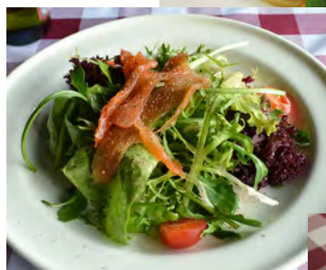
当日沙拉 デイリーサラダ (例)