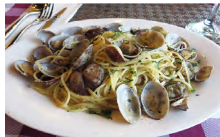
L-13 花蛤面 ボンゴレビアンコ