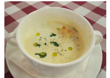
当日汤 デイリースープ (例)

匹萨玛格丽特：蕃茄酱口味匹萨，加鲜莫泽芝士，西红柿，罗勒叶，巴马臣芝士 ピッツァ マルゲリータ