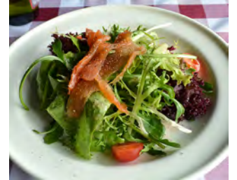
当日沙拉 デイリースアラダ (例)

腊肠蘑菇匹萨：蕃茄酱口味匹萨，加意式腊肠，蘑菇，莫泽芝士，西红柿，巴马臣芝士 サラミとマッシュルーム、トマトソース風味のピザ